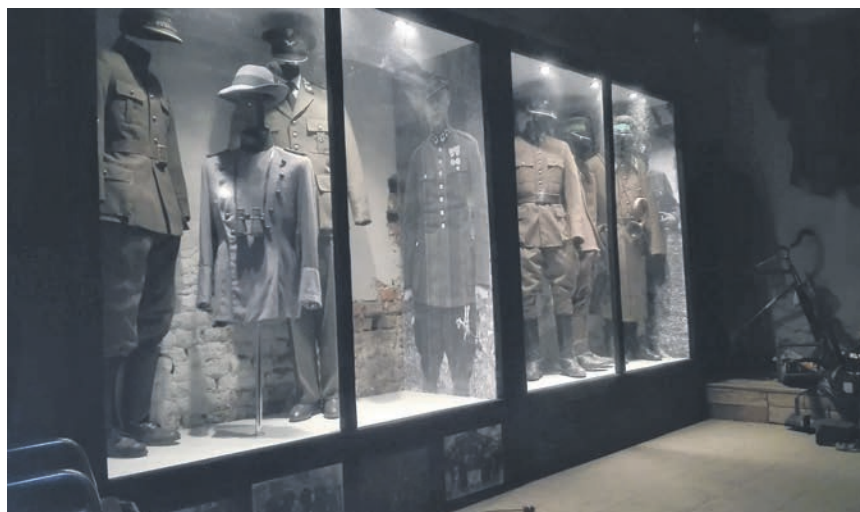
Tworzenie muzeum trwa już 3 lata. Pierwszą wystawę czasową można będzie zobaczyć od 15 września