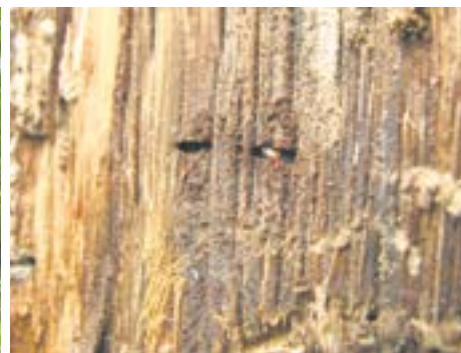
Żerowisko pod korą na osłabionym od suszy dębie