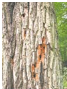
Dzięcioł zaznaczył zasiedlony przez owady dęb