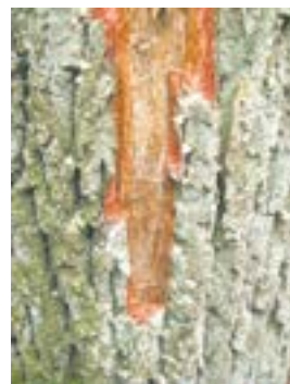
Drzewo trocinkowe żerowisko pod korą osłabionego dębu