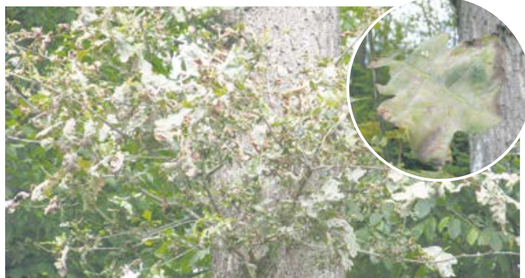
Mączniak prawdziwy dębu i deformacje liści

Problemy nie omijają królowej naszych wielko-