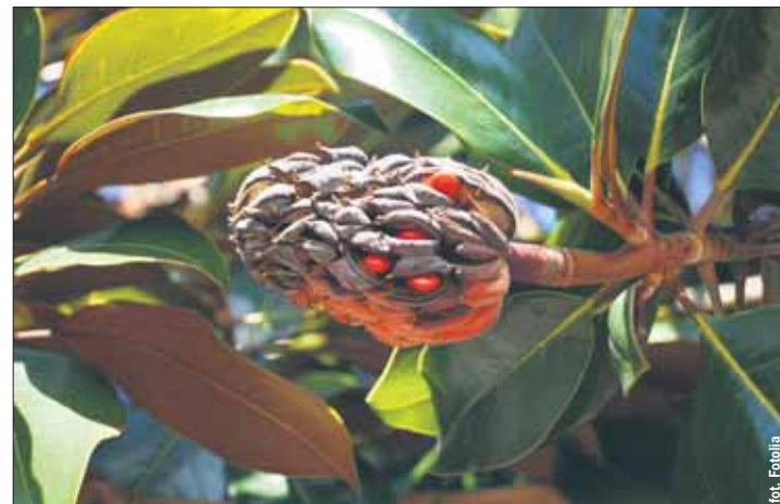
Skórzasty zbiór tzw. mieszków zawierających po jednym owocu magnolii