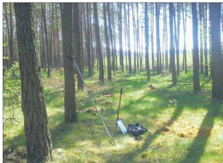
Narzędzia potrzebne przy pracach urządzeniowych - świder glebowy i klupa

Biuro Urządzania Lasu wykonuje także opracowania glebowo-siedliskowe oraz fitosocjologiczne (fitosocjologia - nauka o zbiorowiskach roślinnych), w których tworzeniu miałem przyjemność uczestniczyć. Moim zadaniem było, przede wszystkim, określenie typu siedliskowego lasu - TSL (czyli najprościej mówiąc określenie żyzności danego siedliska) oraz jego zasięgu na podstawie trzech elementów: rodzaju gleby, aktualnego i potencjalnego zbiorowiska roślinnego oraz bonitacji drzewostanu (czyli odzwierciedlenia żyzności siedliska w możliwościach produkcyjnych danego drzewostanu). Aby uzyskać jak najdokładniejszą mapę TSL, w opracowywanym nadleśnictwie