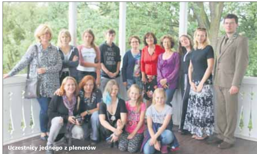
Uczestnicy jednego z plenerów