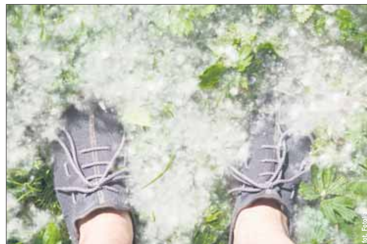
W nasionach topoli