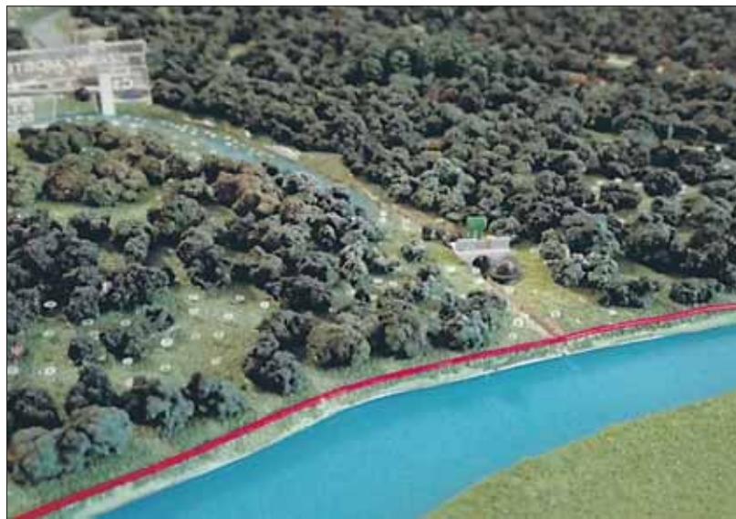
Fragment z nową zastawką

Za oknami śnieg i mróz, w lesie cisza. Jednak Ośrodek Edukacji Leśnej w Czeszewie nie zapadł w sen zimowy. Pomimo pozornego spokoju i braku zmasowanych najazdów gości pracy dla edukatorów z Nadleśnictwa Jarocin nie brakuje. Pod koniec ubiegłego roku na „warsztatach” trafiła makieta, znajdująca się w sali przyrodniczej na pierwszym piętrze ośrodka. Ta przestrzenna, trójwymiarowa forma zapewnia zwiedzającym miniaturowy obraz walorów przyrodniczych, jakie czekają na nas za Wartą. Musimy pamiętać, że z upływem lat las się zmienia, dlatego postanowiliśmy ten element edukacji uaktualnić i nanieść na niego kilka poprawek.