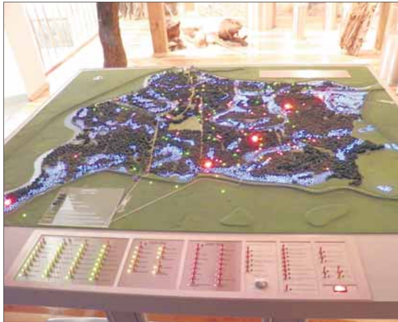
Makieta w nowej odsłonie