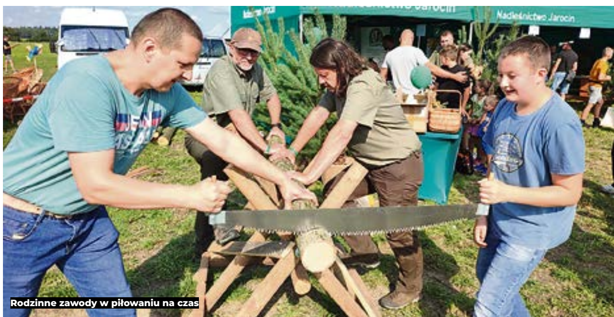
Rodzinne zawody w piłowaniu na czas