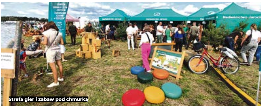
Strefa gier i zabaw pod chmurką