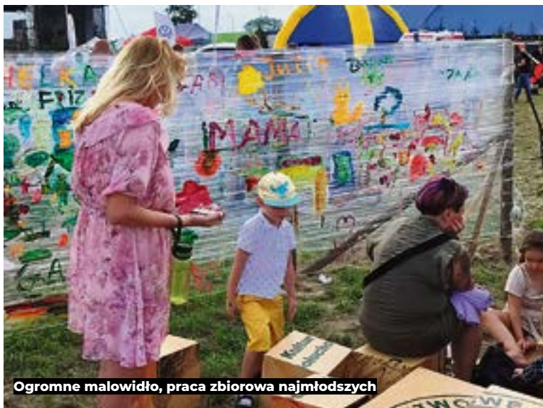
Ogromne malowidło, praca zbiorowa najmłodszych