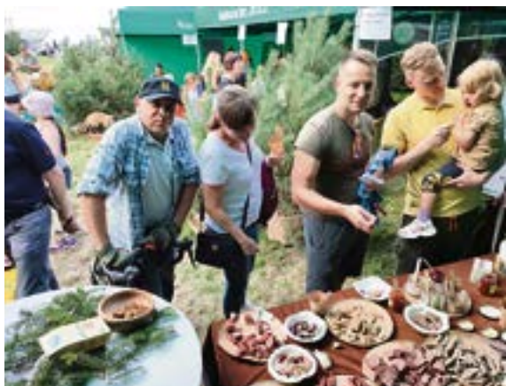
Degustacja dziczyzny oraz sosów owocowych pochodzenia leśnego