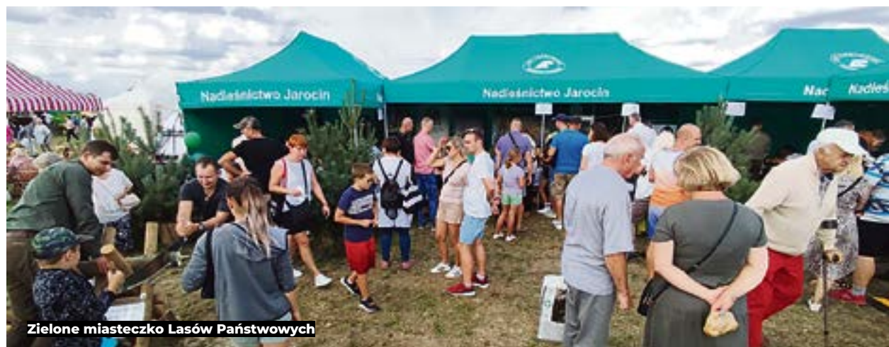
Zielone miasteczko Lasów Państwowych