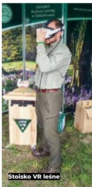
Stoisko VR leśne