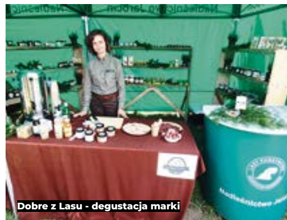
Dobre z Lasu - degustacja marki