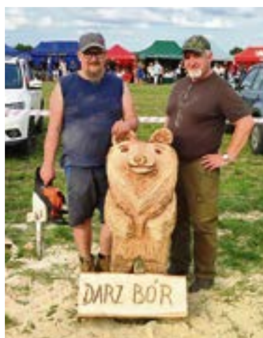
Lipa zamieniła się w sympatycznego misia. Z autorami pracy