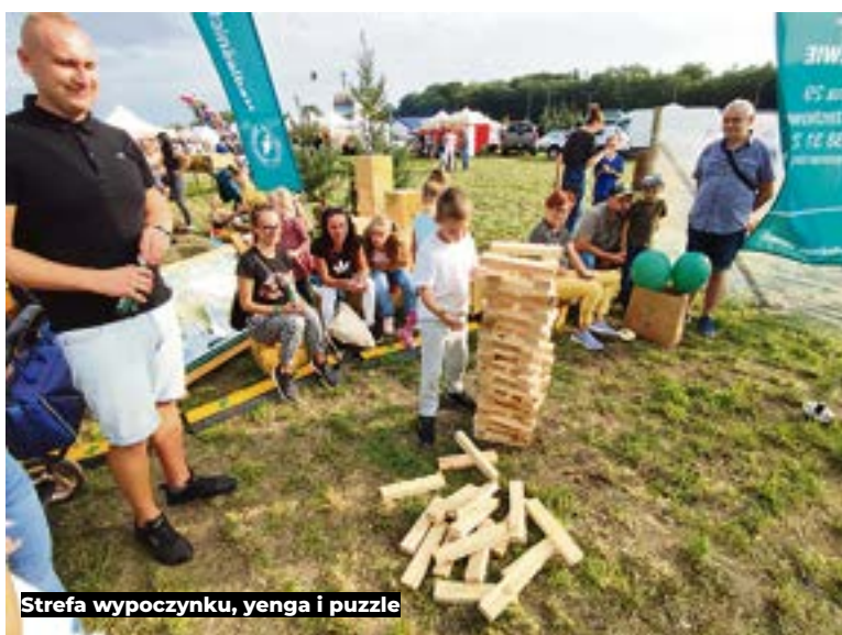
Strefa wypoczynku, yenga i puzzle