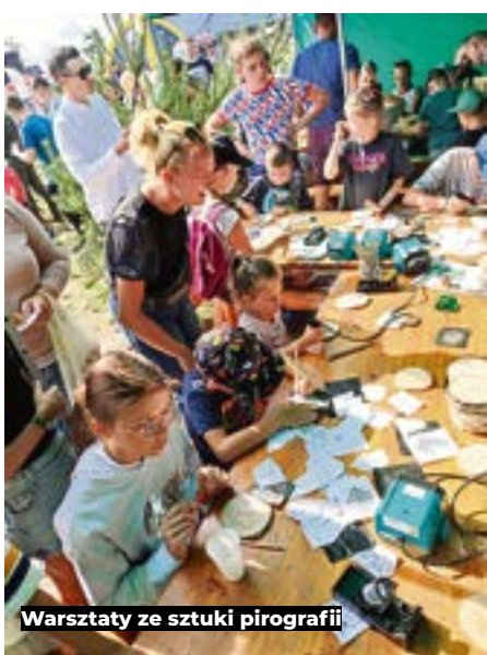
Warsztaty ze sztuki pirografii