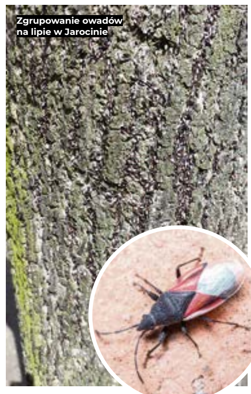
Zgrupowanie owadów na lipie w Jarocinie