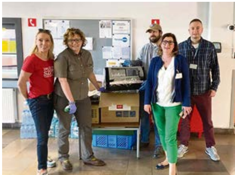
Pomoc z poznańskiej dyrekcji LP

ratowania zdrowia i życia. Polska służba zdrowia codziennie walczy o ludzkie życie. Dziękuję wszystkim, którzy włączają się w walkę z epidemią” – podkreśla minister środowiska Michał Woś. Udzielenie wsparcia finansowego przez jednostki organizacyjne Lasów Państwowych na zwalczanie epidemii możliwe jest bez rezygnacji z realizacji zadań w zakresie gospodarki leśnej.