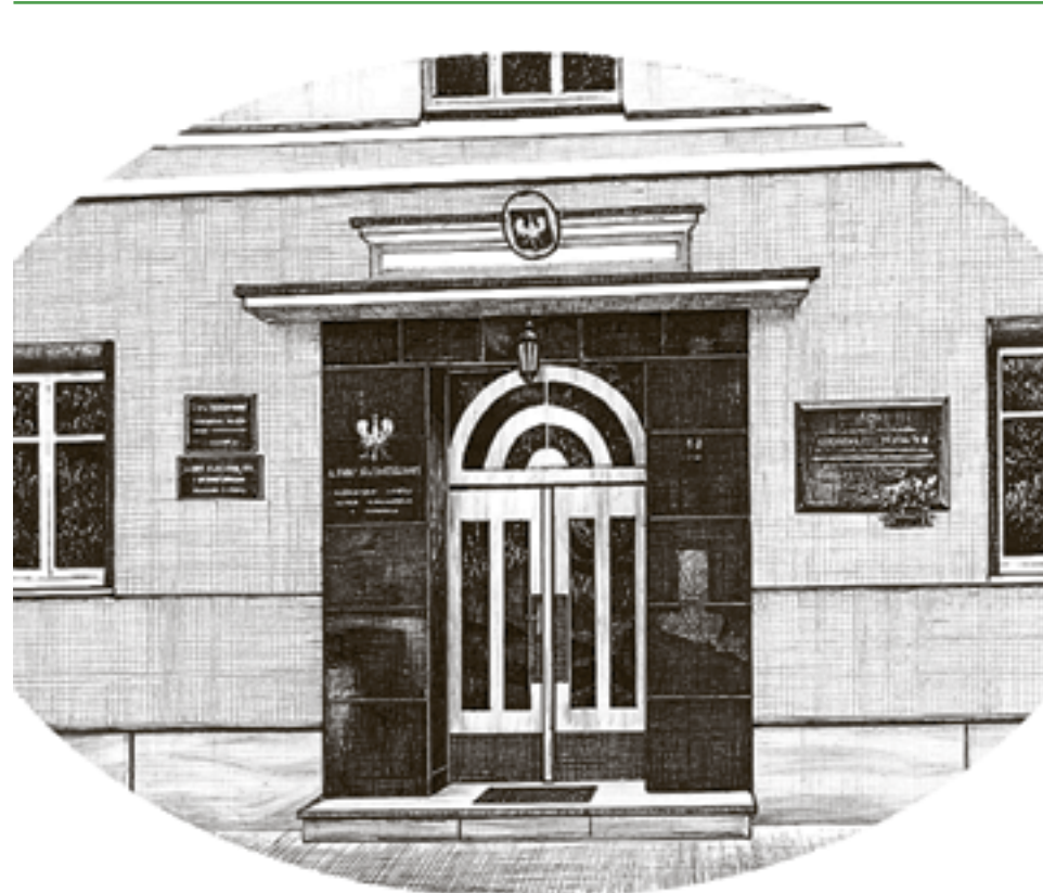
Szkic budynku RDLP w Poznaniu przy ul. Gajowej

Wisłą przez Tucholę i Chojnice do granicy polsko-niemieckiej, zwiększając jej powierzchnię do 375,6 tys. ha. Pod koniec dwudziestolecia międzywojennego, w 1938 r. nastąpiła jeszcze jedna zmiana granic dyrekcji, a dotyczyła tym razem lasów w całym kraju. Według nowego podziału administracyjnego poznańska dyrekcja została podzielona na 52 nadleśnictwa oraz 3 inne jednostki pozostające w zarządzie dyrekcji.