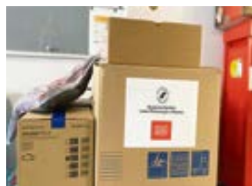
Przekazany nowy sprzęt

RDLP oraz lokalne Stowarzyszenie „Leśnicy dla Polski” sfinansują zakup urządzeń do dezynfekcji i sterylizacji, potrzebnych medykom i pacjentom szpitali zakaźnych w Tomaszowie Lubelskim i Puławach.