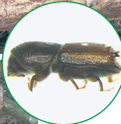
Wizytujący Nadleśnictwo Jarocin pracownik ZOL (Zakład Ochrony Lasu) opowiadał o przypadku, kiedy kornik przeniósł się ze stosu chrustu znajdującego się na przydomowym podwórku na położony 200 metrów dalej las.

Wylęgające się z jaj larwy korników również drążą chodniki, w których zmieniają się w poczwarki, a następnie dorosłe owady. Przed opuszczeniem drzewa, w którym przyszedł na świat, poszerzają chodniki - to tzw. żer uzupełniający. Chrząszcze te w zależności od warunków pogodowych mogą mieć podwójną generację, nie wyklucza się również siostrzanę. Dlaczego ostrożny? Nazwa nie pochodzi od „zębienia” aparatu gębowego, a od wystających ząbków na ścięciu pokrywy kornika, gatunek łatwo rozpoznać właśnie po tych właśnie 3 ząbkach (skrzydła chrząszcza).